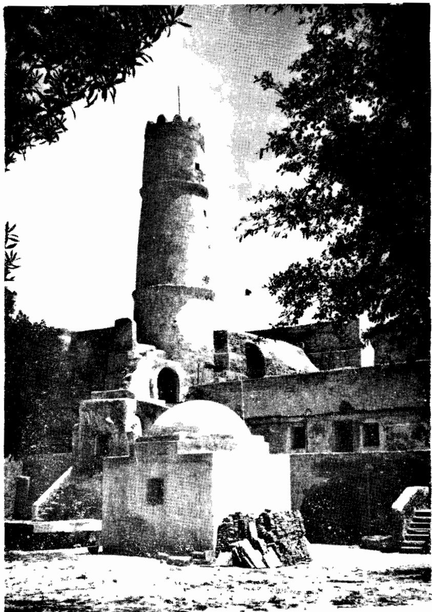
رباط المستنير . منظر من الداخل