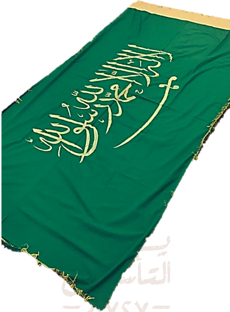
بيرق الشيخ مناحي الهيضل في معارك توحيد المملكة.