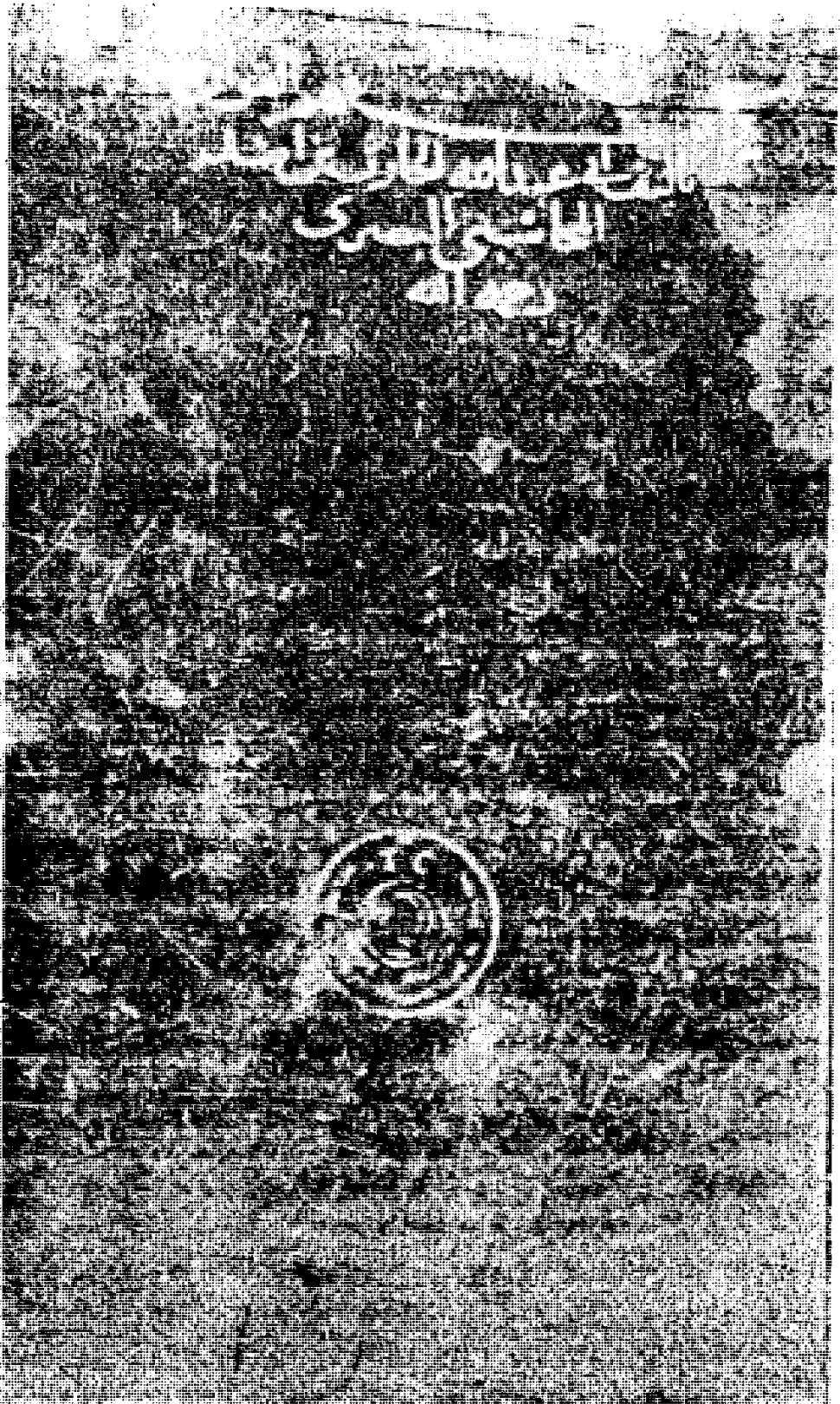
صورة غلاف مخطوطة فهم القرآن