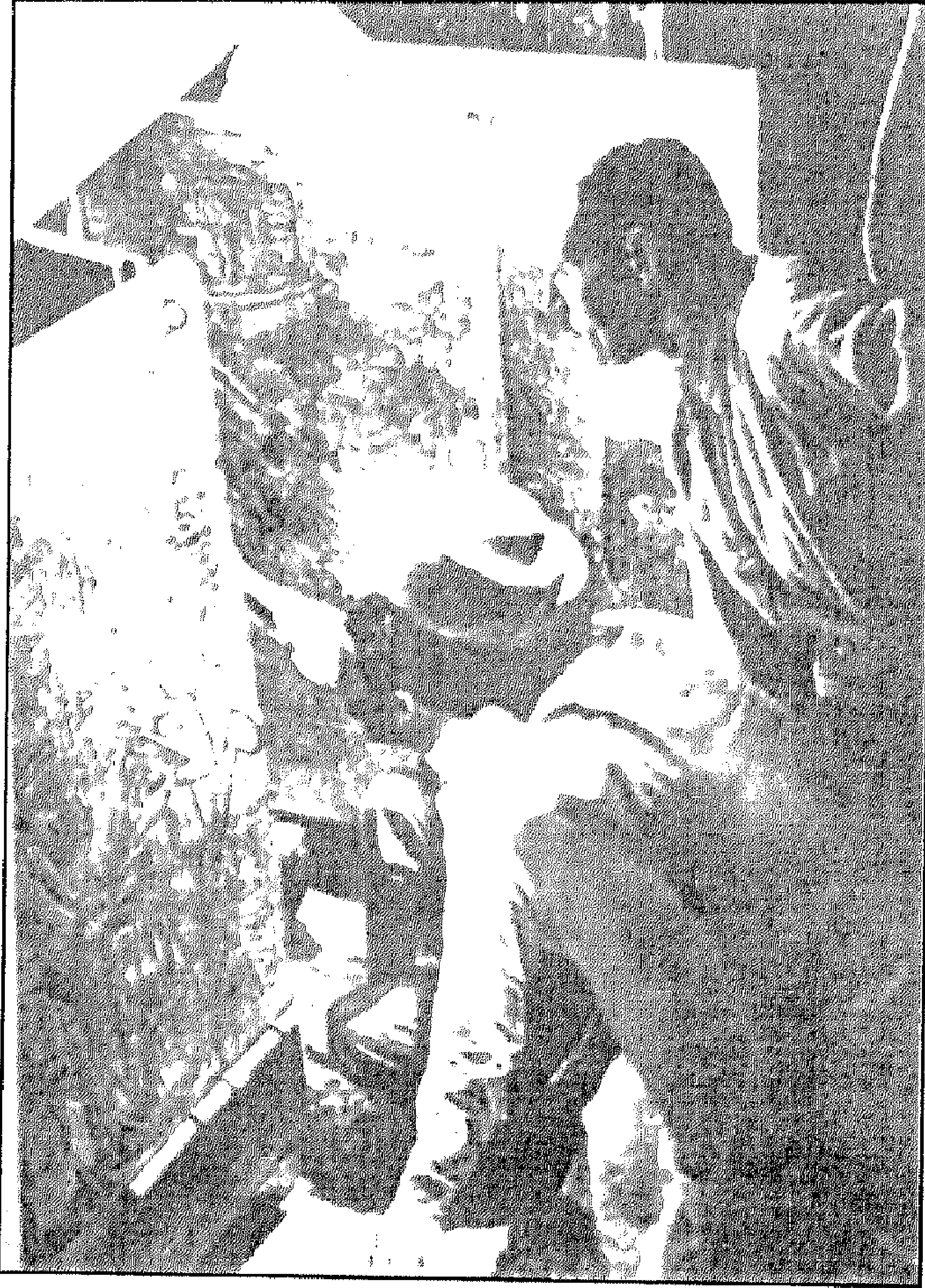
د. كارتر ومساعدوه داخل قبر الفرعون

ومن الطريف أيضاً بخصوص موضوع اللعنة ومدى واقعيتها أن الدكتور كارتر مكتشف قبر الفرعون لم يصب بأي أذى طول حياته ومات بصورة طبيعية ولذلك تظل لعنة الفراعنة لغزاً بين الحقيقة والخيال !