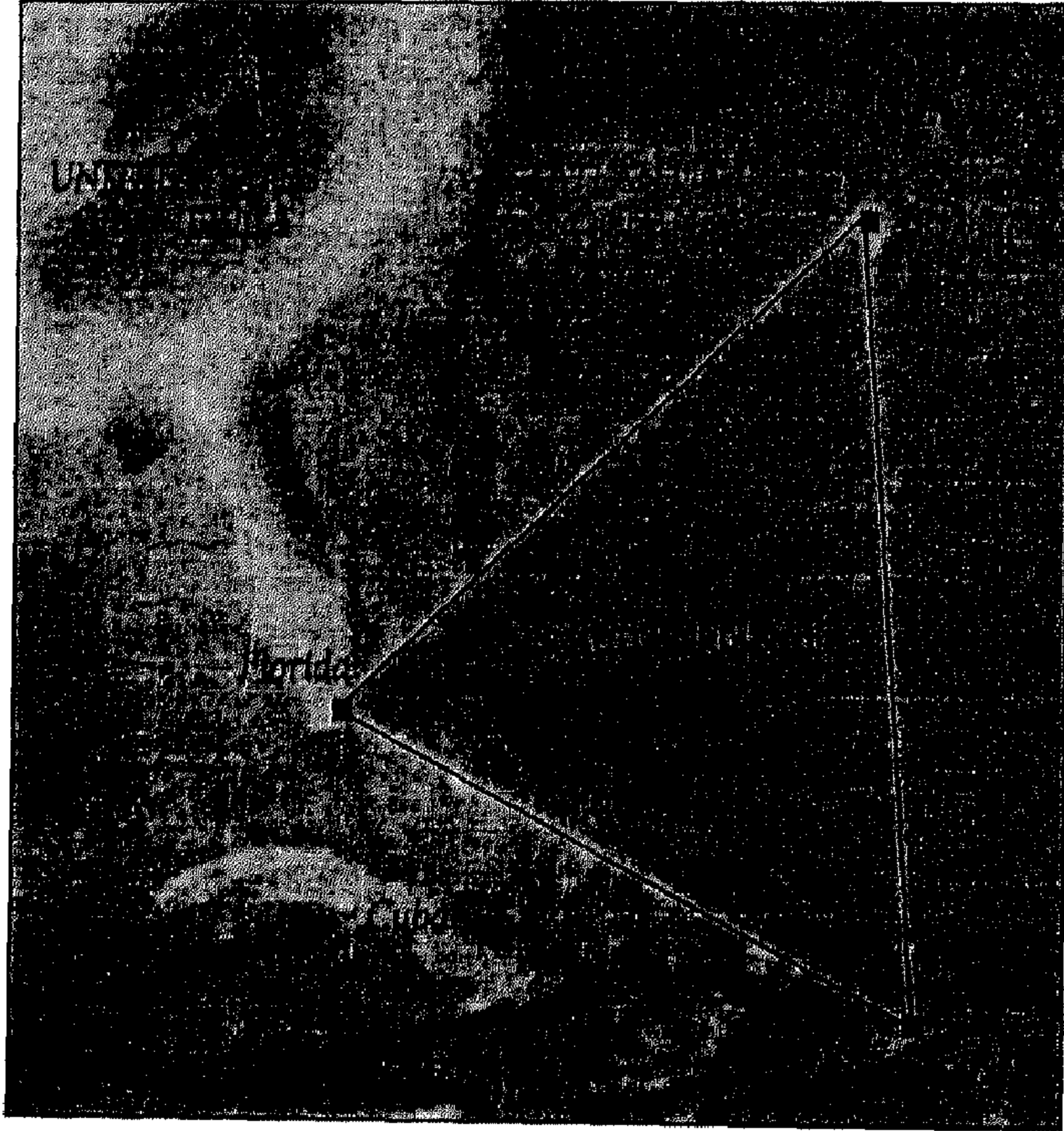
منطقة مصورة تبين حدود مثلث برمودا

وهكذا سيظل لغز مثلث برمودا قائماً إلى أن يأتي اليوم الذي يتوصل فيه العلم والعلماء إلى تفسير أسباب كوارثه الغامضة.