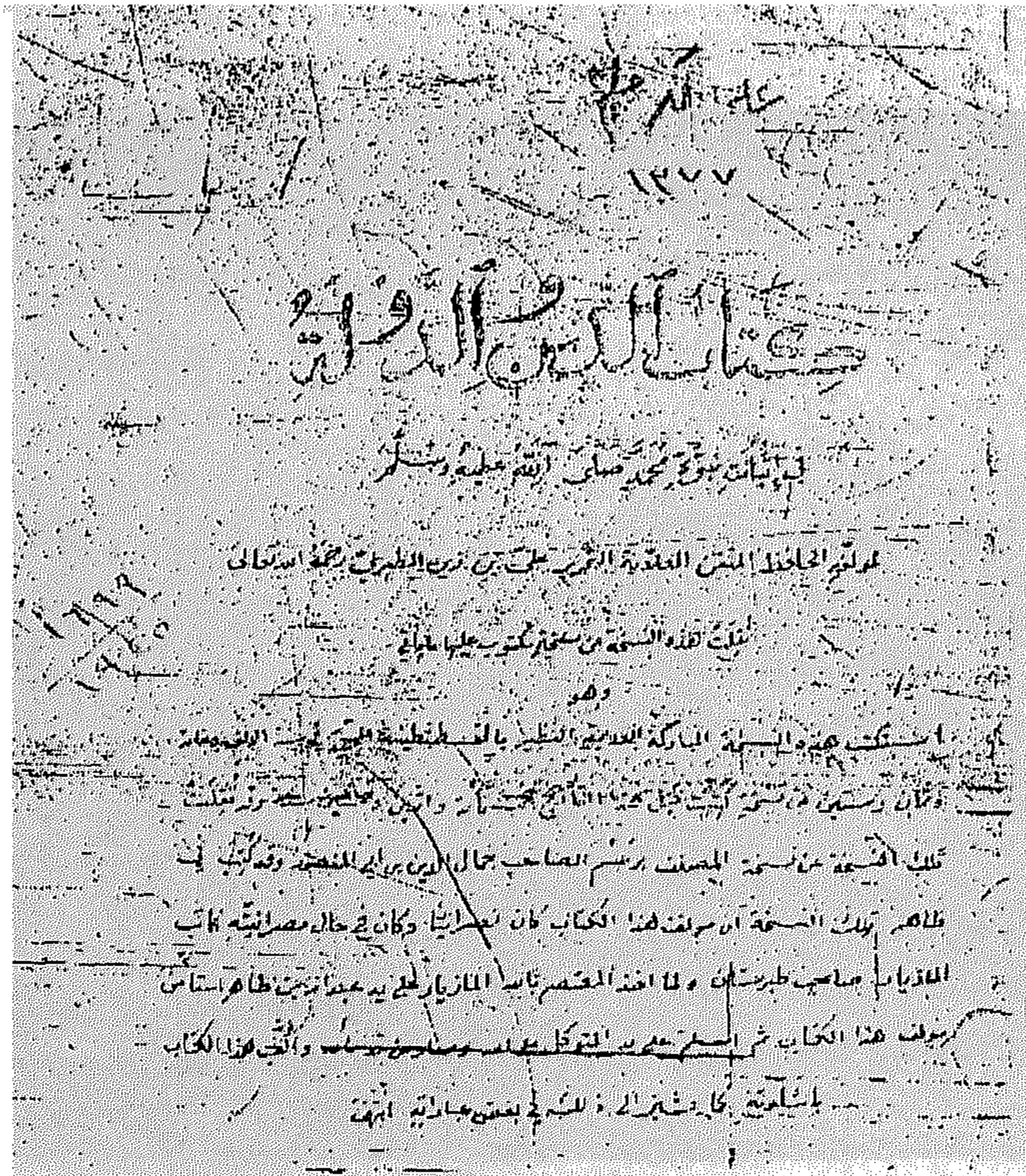
صورة الصفحة الأولى من الكتاب