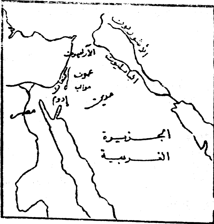
مناطق الساميين قديماً

وتدل الآثار البابلية على أن بابل كان لها السلطان على أرض كنعان في الألف الثالث قبل الميلاد ، وكانت حضارة الكنعانيين شديدة التأثير