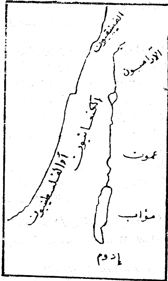
المنطقة قبل زحف العبرانيين

والى الشرق من نهر الأردن ثم الى جنوب البحر الميت تقع الممالك الثلاثة عمون ومؤاب وإدوم ، وسكانها ينحدرون - كالآراميين - من سهل