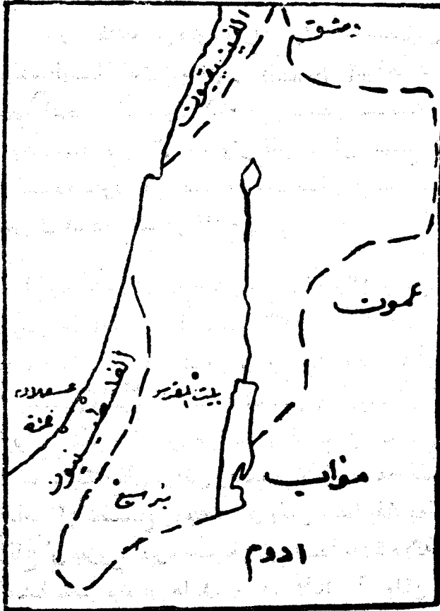
مملكة داود في أقصى اتساعها

وقبل أن ندع عهد داود الى عهد ابنه وخليفته سليمان نذكر أنه ينبغي ألا نبالغ في تقدير سعة ملك داود ، ونقتبس لذلك خريطة من J.W.D. Smith (١) توضح أقصى اتساع لمملكة داود :