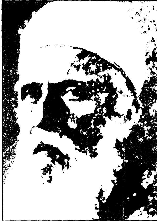
عبدالبهاء بن مؤسس الحركة