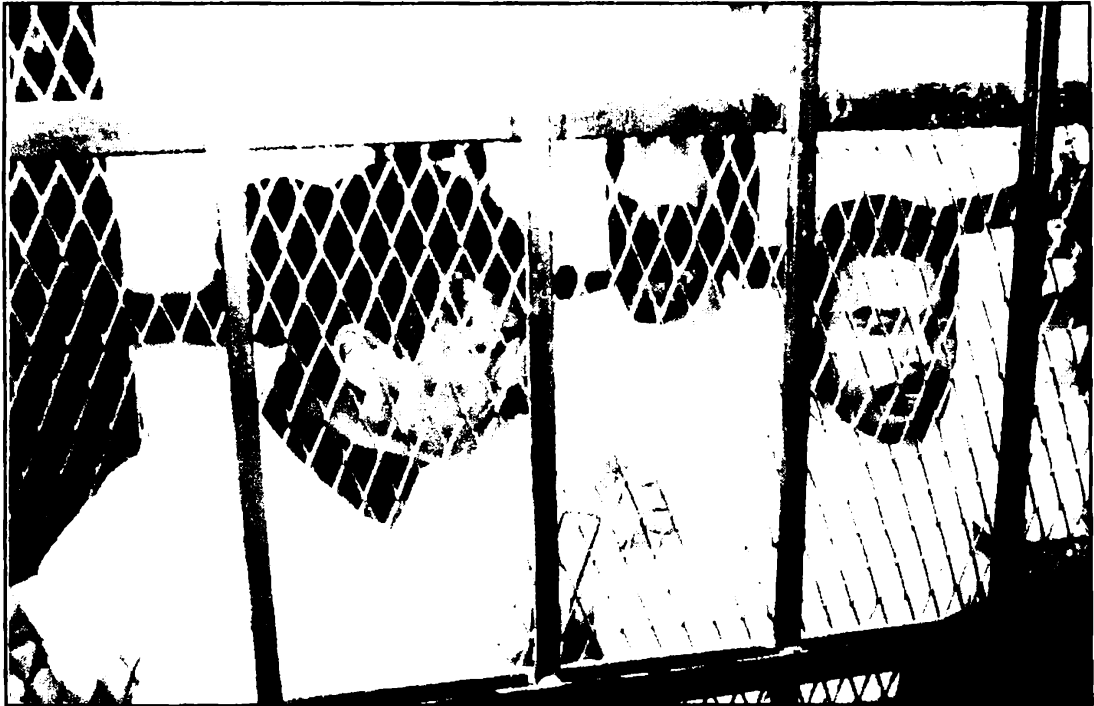
أبو شوشه وأعوانه داخل قفص الاتهام أثناء محاكمتهم