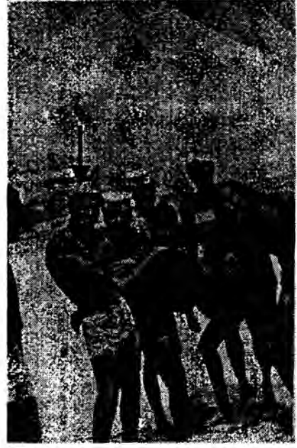
أيام الشباب (مرسى مطروح ١٩٦٩)