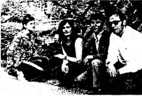
زملاء الدراسة في طوكيو - حديقة القصر الامبراطوري ١٩٧٢