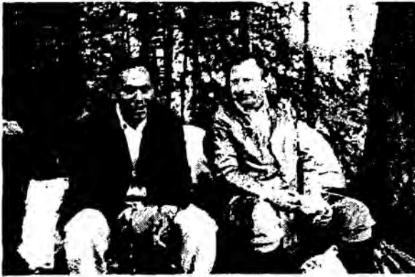
مع هنريش لامهوف - استاذ الكيمياء في جامعة "بون" في غابات نهر الراين بألمانيا ١٩٨٠