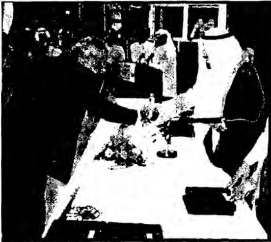
استلام جائزة أكاديمية العالم الثالث للكيمياء - صاحب السمو لخامة أمير دولة الكويت الشيخ جابر الأحمد الصباح الكويت نوفمبر ١٩٩٢