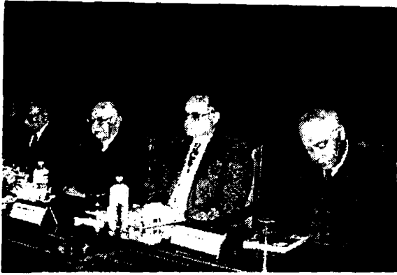
مع الأستاذ الدكتور مصطفى كمال حلمي رئيس مجلس الشورى ١٩٩٩