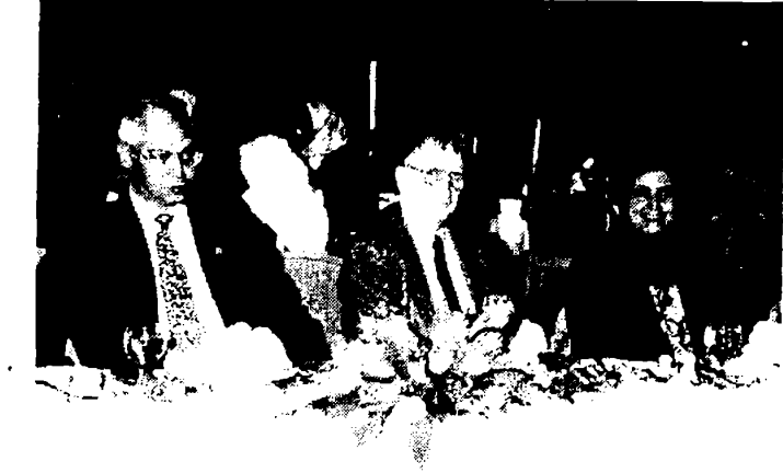
مع الأستاذة الدكتورة / نورية العوضي - دولة الكويت عام ١٩٩٨