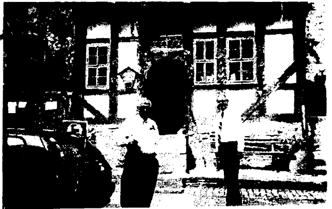
د.ا / ايجون فانجنجلي رئيس الجمعية الكيميائية الألمانية ورئيس جامعة هاله السابق - ألمانيا ٢٠٠٠