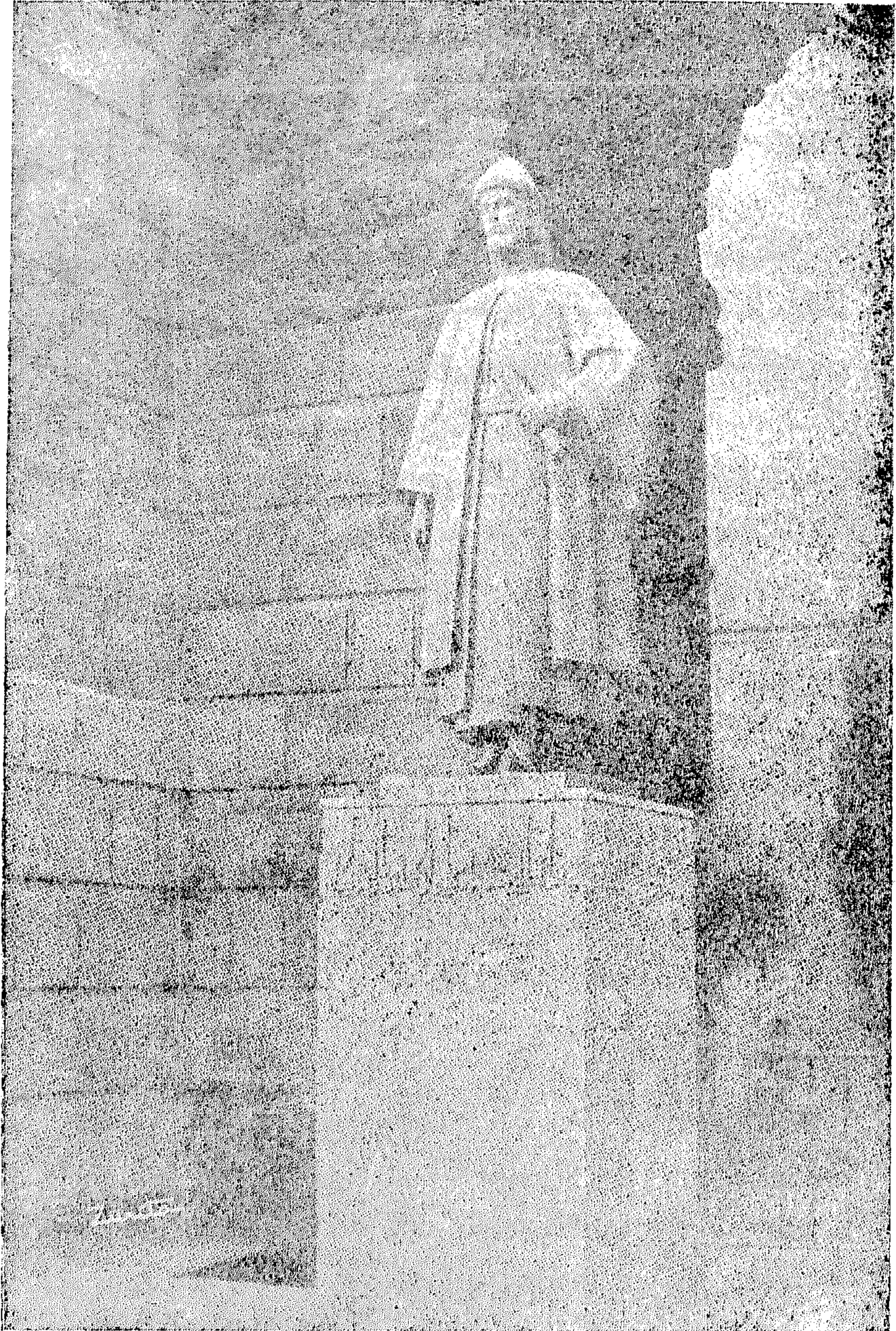
تمثال ابن حزم ، أقامته بلدية قرطبة عام ١٩٦٣م ، أمام باب أشبيلية ، أو العطارين ، وكان يؤدي إلى بلاط مغيث ، الحى الذى نشأ فيه ابن حزم ... من هنا كان طريقه اليومى إلى المسجد الجامع ، طالبا ، وأستاذا ، أو للصلاة !