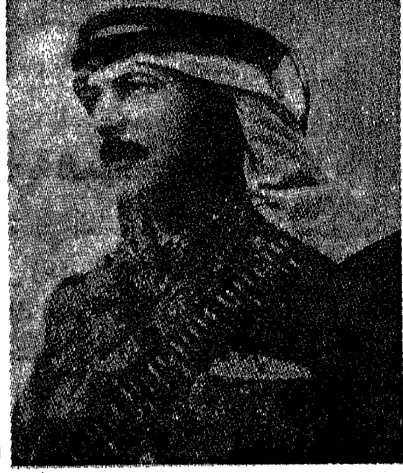
الشهيد القائد عبد القادر الحسيني

فقد كان يعمل كجهاز لنشر الدعاية للثورة .