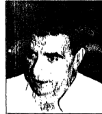
نادر أبو الفتوح