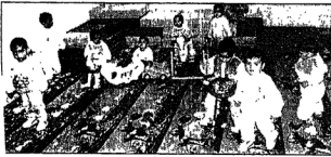
وراء سعادة هؤلاء قلوب رحيمة