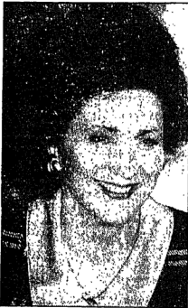
السيدة سوزان مبارك

والمحور الثالث هو التنمية الاقتصادية للمنطقة من خلال تشجيع شباب الخريجين على القيام بمشروعات اقتصادية مناسبة ويتم ذلك بالتعاون مع المستنق الاجتماعي للتنمية.