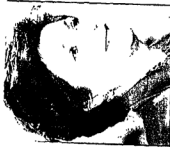
السيدة سوزان مبارك

جديدة وهو معلقه مصر بإعلان عقد جمعية الأطفال في عام ٨٦ بيده عمل متكامل وشامل من أجل رعاية كل أطفال مصر لإيجاد الطفل الصحيح بدنيا وصحيا ونفسيا. وقال الدكتور محمد جيهان الشاذلي خاتمة لورس: إن الرعاية الصحية ستكون بمثابة ستار متكامل الحفاظ على صحة الأطفال وأنه تم تطبيق التأمين الصحي على الطفل الوليد وضع البرامج من الرضخ وتجسير خدمات الصحة في مختلف الولايات خاصة الصحية ورعاية الأمهات وصورة مطبوخة في مختلف الأقاليم مشيرة إلى أن الخدمات غير الكافية والجمعيات غير الكافية وقال سلام: إن الوزارة قامت بجهود إيجابية في تحسين الخدمات على الأبرياء باعتباره أفضل طريق لحماية الطفل من الرضخ، بل أننا نستعمل استئجار طي الأبرياء في خلال ١٥. التين تم توفيرها في بريطانيا على أحدث المرات وقد كان هذا التخصص جليا فاستقبلنا نجده