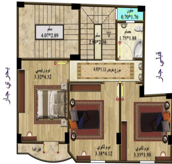
غربي شارع 6.00 م