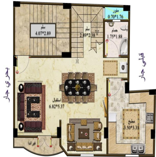
غربي شارع 6.00 م