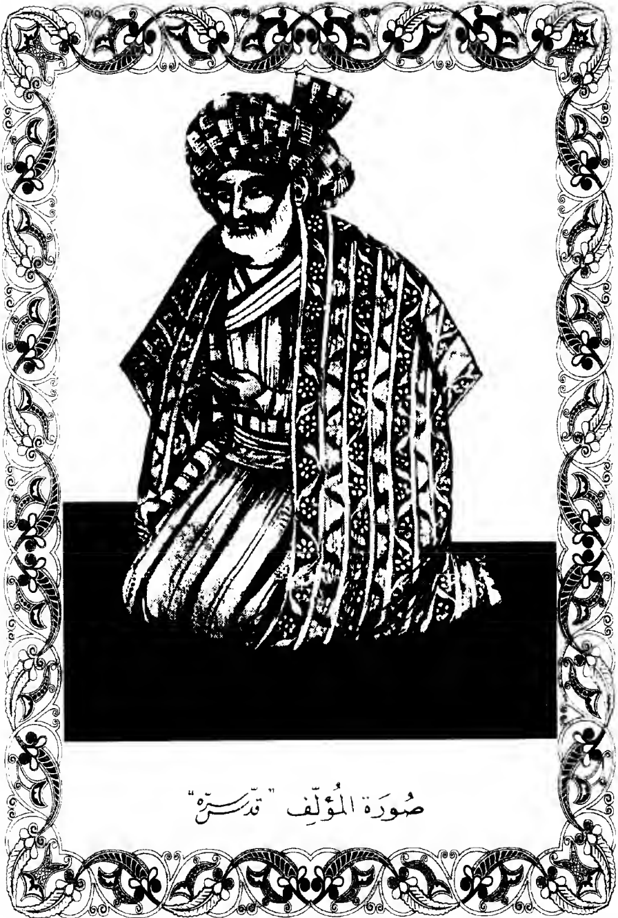
صُورَةُ الْمُؤَلِّفِ "قَدَسْرَ"